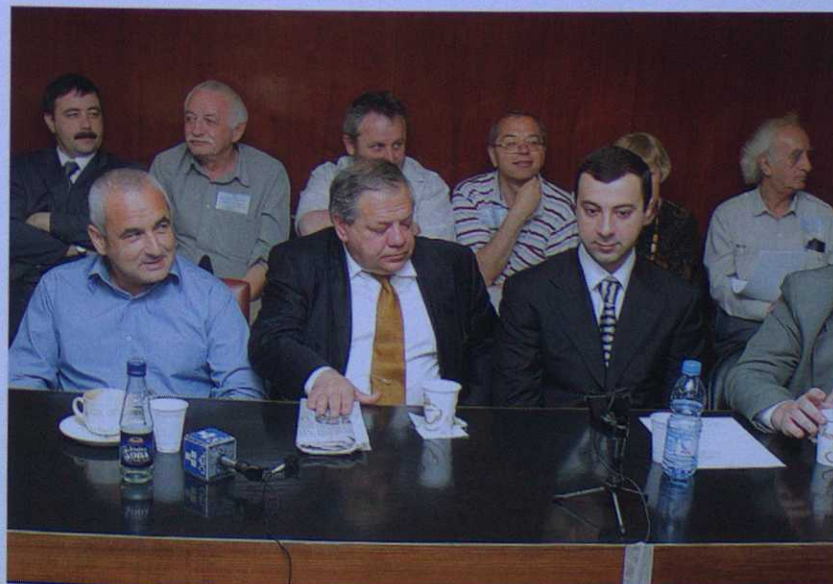
2004 | Миньян № 14

тории был создан Всемирный конгресс горских евреев. По масштабу международной значимости организация сразу дала огромный импульс горско-еврейскому народу, ощутившему принадлежность к большой семье, пробудила к сплоченности.