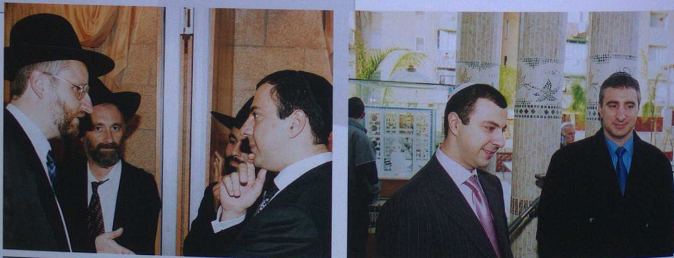
Миньян № 14 | 2004