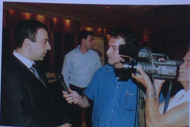
Миньян № 14 | 2004

Из-за прекращения финансирования приостановлены программы Конгресса, связанные с языком, учебной, культурой, издательской деятельностью, заморожен целый ряд проектов в США, Азербайджане, Израиле и даже России. Сегодня как никогда остро ощущается необходимость в создании Попечительского совета Всемирного конгресса горских евреев, в который вошли бы известные бизнесмены и уважаемые представители нашего народа. Этот вопрос непростой, но вполне решаемый, несмотря на сложные обстоятельства. Готов ли я был к такому повороту судьбы, разрабатывая программу возрождения горских евреев?