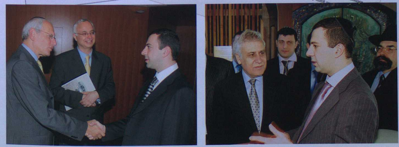
2004 | Миньян № 14