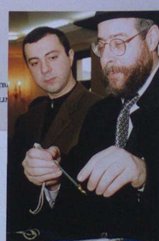
Миньян № 14 | 2004