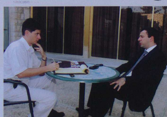
2004 | Миньян № 14