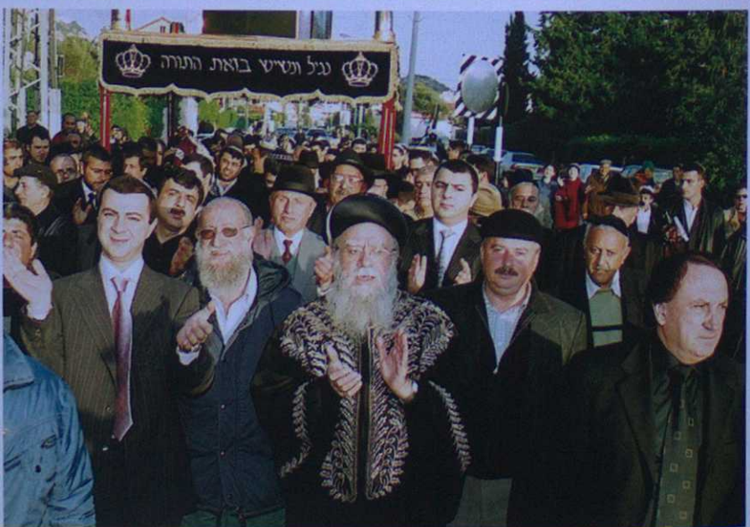
Миньян № 14 | 2004